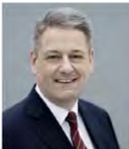
ANDRÄ RUPPRECHTER Bundesminister für Land- und Forstwirtschaft, Umwelt und Wasserwirtschaft

Die Biodiversitäts-Strategie Österreich 2020+ ist eine wesentliche Grundlage dafür!